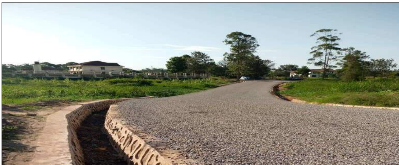
Ujenzi wa barabara ya Wanja wa Mashujaa - NMB kijiji cha Bunazi kwa kiwango cha lami km1.6