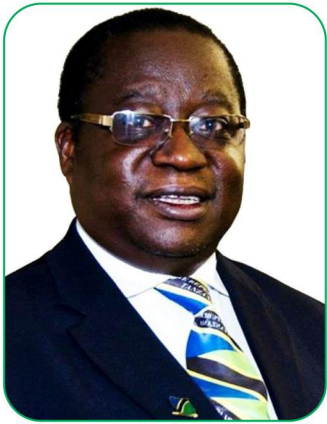
MHE. BALOZI DIODORUS BUBELWA KAMALA MBUNGE WA JIMBO LA NKENGE