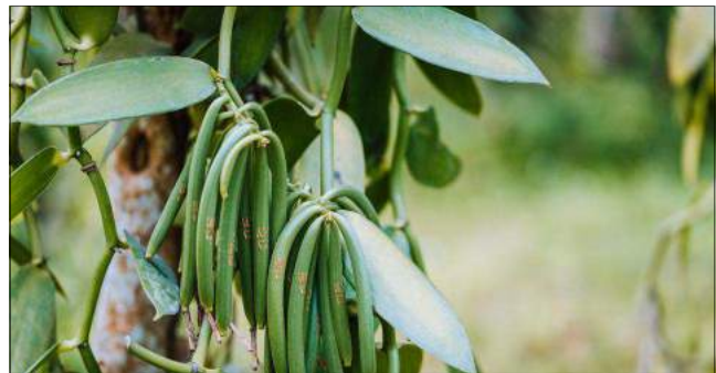
Shamba la vanilla Mugongo Kata ya Ruzinga