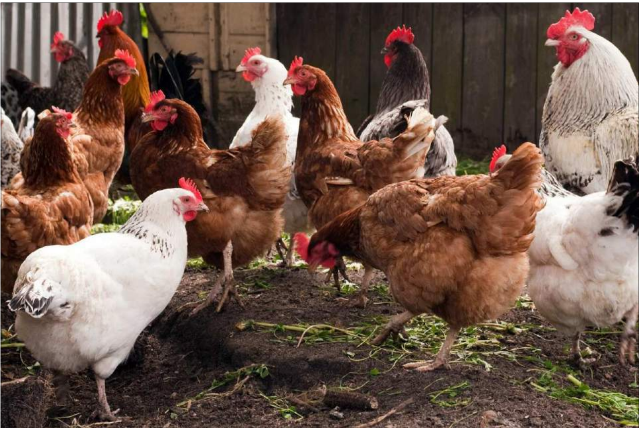
Ufugaji wa kuku Kijiji cha Kakindo.