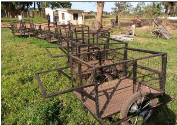
Mikokoteni ya kuzolea takataka - Bunazi