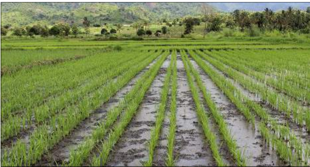
Shamba la mpunga Katebe Mutukula