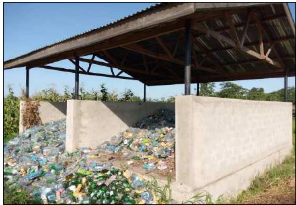
Kizimba cha kukusanyia taka - Soko la Bunazi