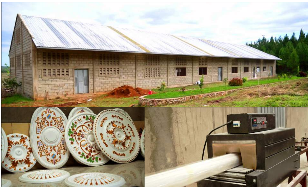
Kiwanda cha uzalishaji wa Gypsum Board - Gera

Kiwanda kikubwa kimoja cha kukoboa kahawa cha Olam kimejengwa na kukamilika. Ongezeko hili limechangia kukua kwa sekta ya biashara kutoka asilimia 40 Mwaka 2015/2016 hadi asilimia 65 Mwaka 2019/2020.