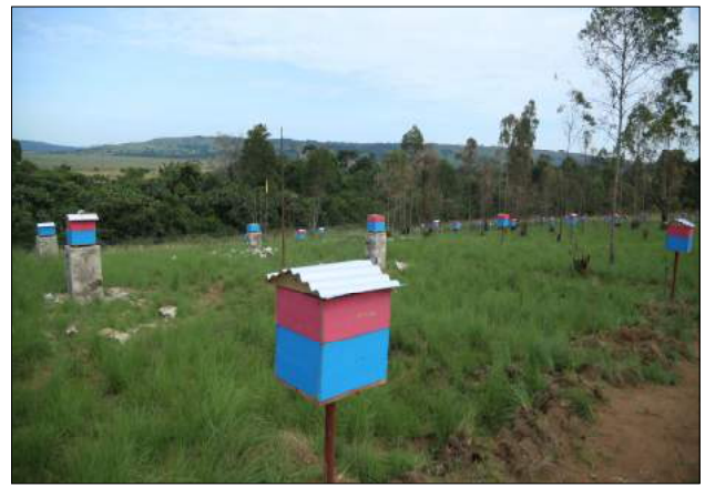
Shamba darasa la ufugaji wa nyuki wa kisasa - Gera