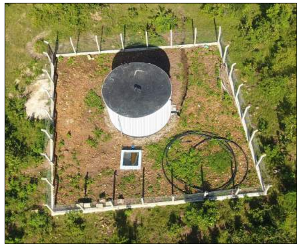
Tenki la maji Kibeo