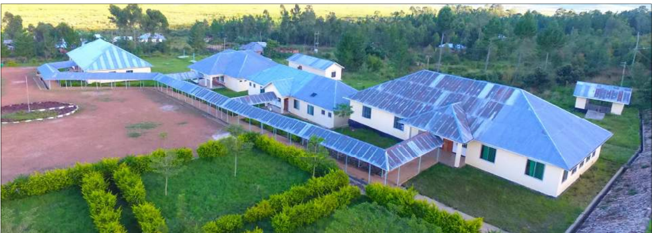
Kituo cha Afya - Kabyaile kata ya Ishozi ni kituo kipya kilichojengwa