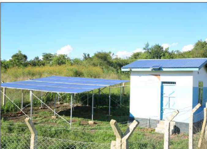
Mradi wa Maji - Kijiji cha Nyankere