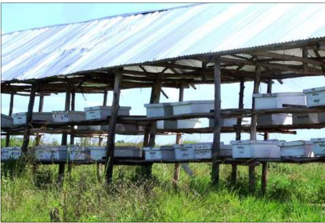
Mizinga ya kisasa ya kufugia nyuki - Nsungu