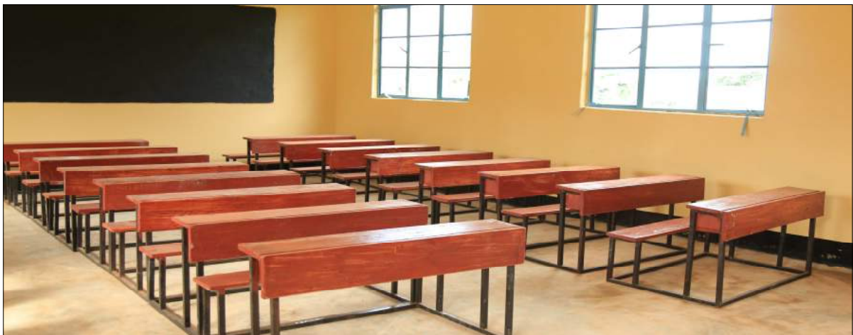
Madawati katika shule ya Msingi Mutukula