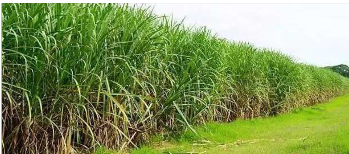
Shamba la Miwa katika kata ya Kassambya