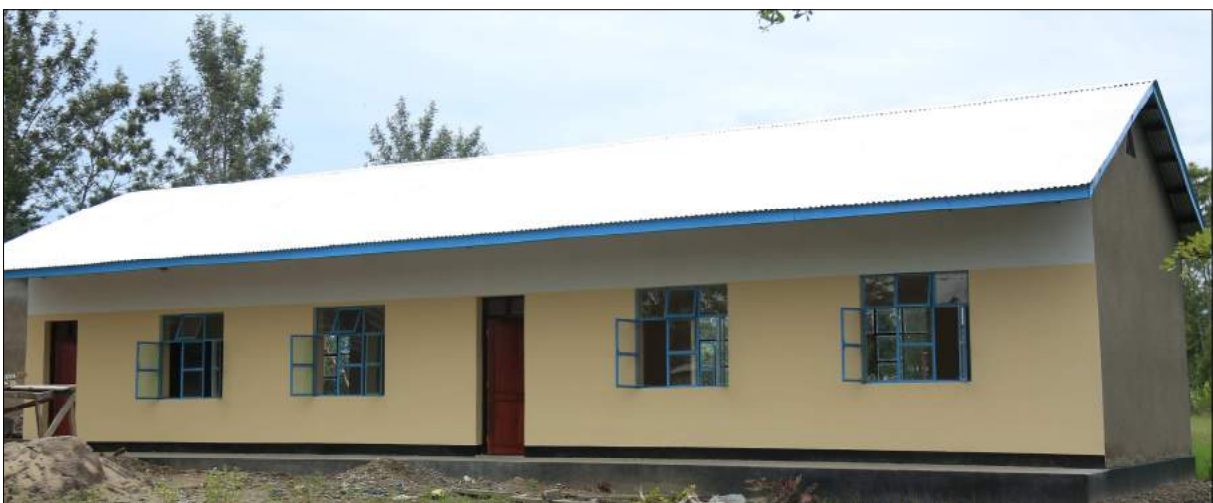
Vyumba vya Madarasa Shule ya Msingi Kimkunda