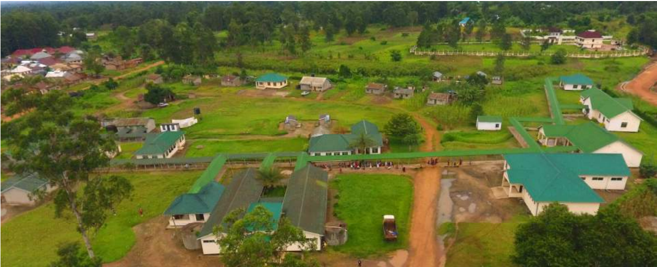
Ukarabati na Ujenzi wa Miundombinu ya Kituo cha Afya Bunazi.