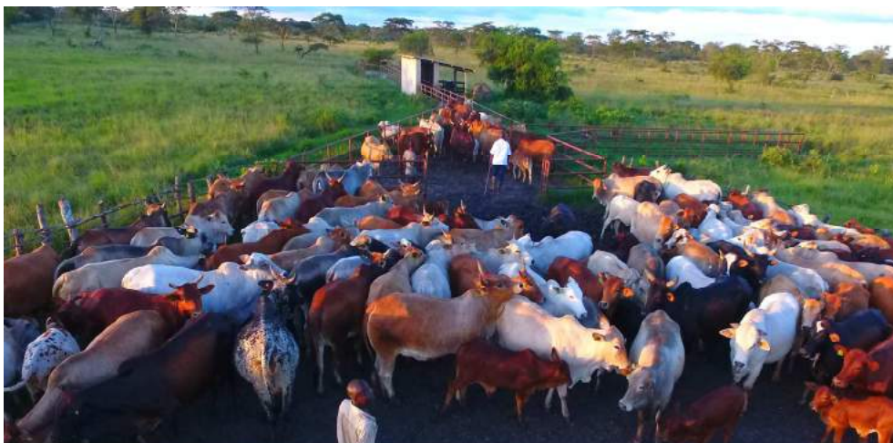
Baadhi ya Ng'ombe aina ya Borani wakiingia kwenye joshu la kisasa katika Shamba la Bubale