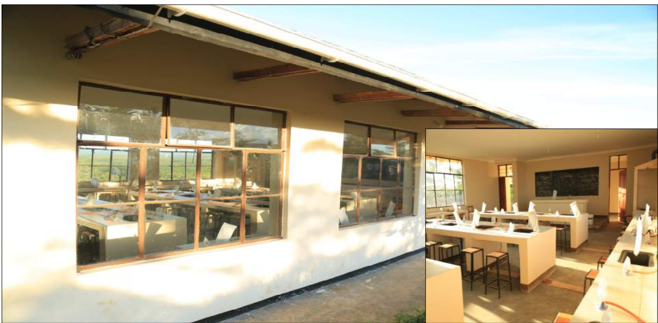
Vyumba vitatu vya maabara za sayansi - Shule ya Sekondari Mabale