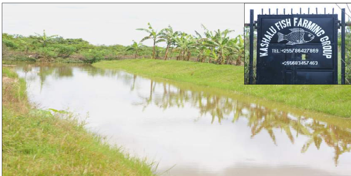
Baadhi ya Mabwawa ya kufugia Samaki katika shamba la Kashalu Kata Mutukula