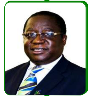
Mhe. Balozi Dkt. Diodorus Buberwa Kamala Mbunge wa Jimbo la Nkenge